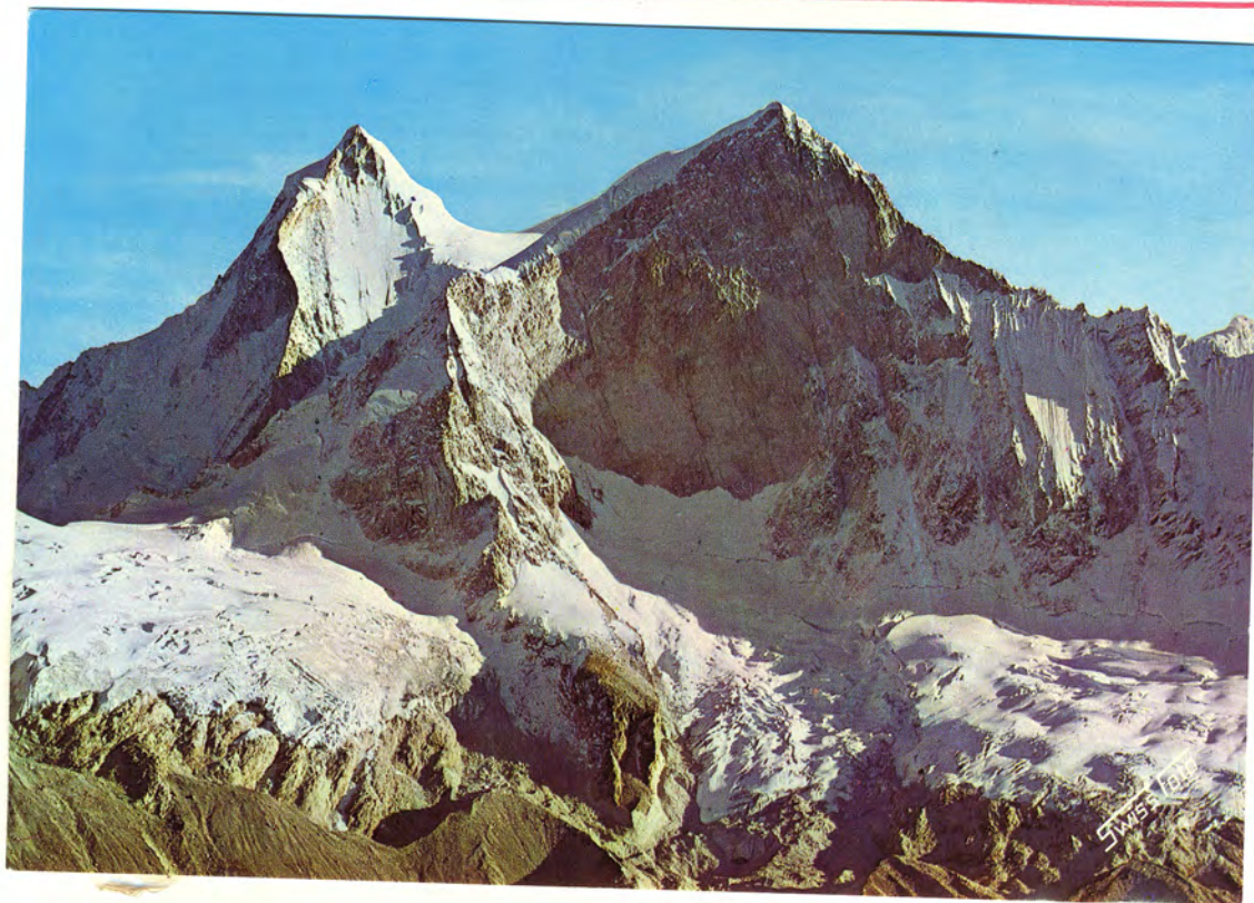
המקום הזה - מקום בפכו שהשם שלו הוא אלאקל

ששך * שנת * שלום * * * * * * * * * * * * * * * * * * * *