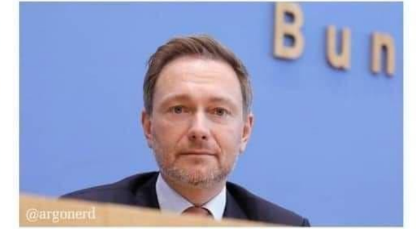
@argonerd Christian Lindner in der Bundespressekonferenz: Der FDP-Chef ist dafür, Geimpften schneller ihre Grundrechte zurückzugeben.

MEINUNG | FDP-Vorsitzender fordert "Gebt Geimpften die Grundrechte zurück!" 03.02.2021, 14:34 Uhr | Ein Gastbeitrag von FDP-Chef Christian Lindner